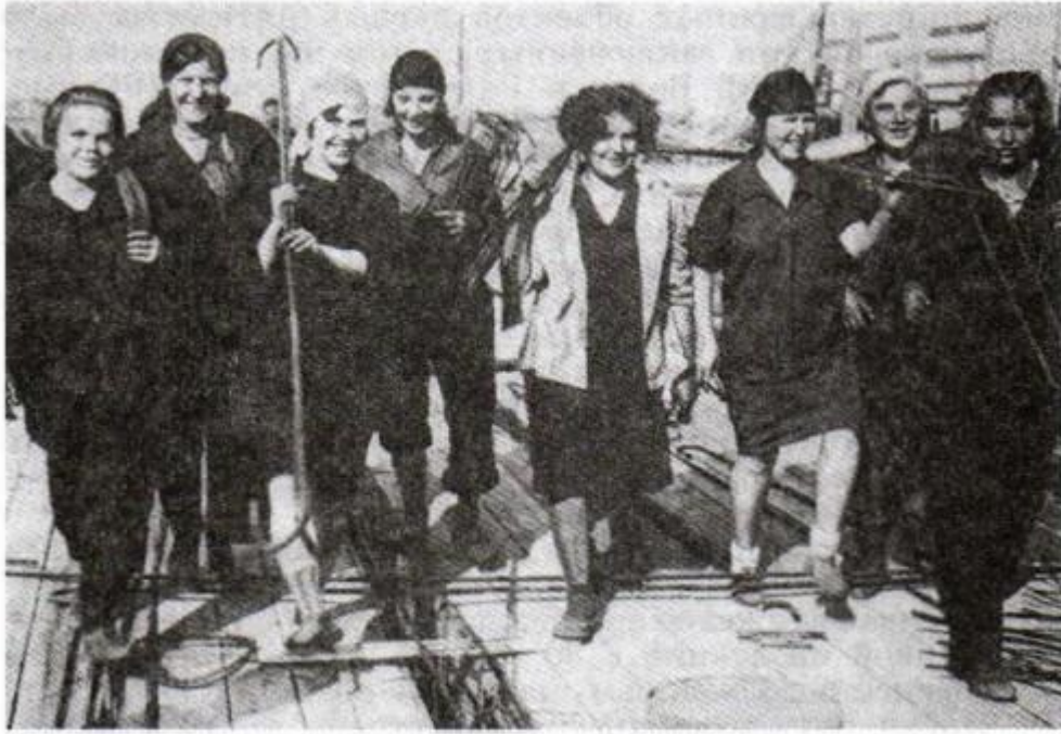
Ударная бригада женщин-строителей. Начало 30-х гг. XX в.