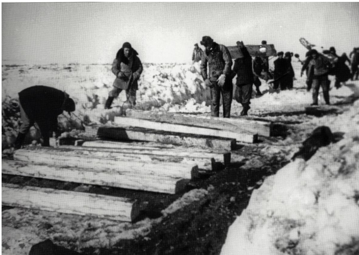
Труд работников ГУЛАГа