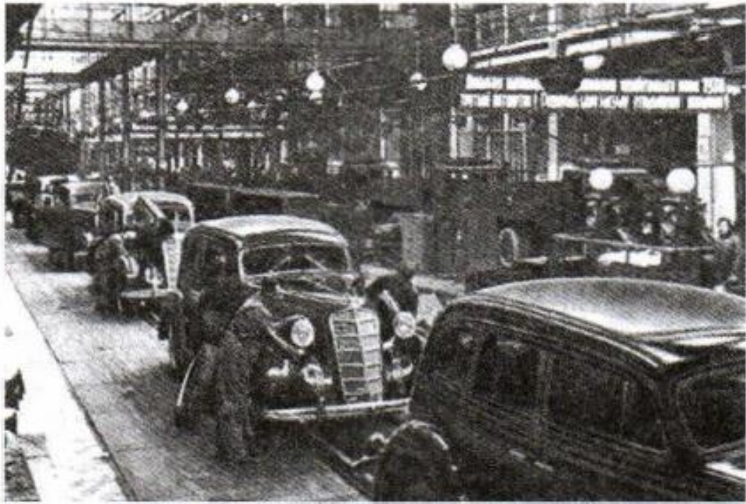
На конвейере первые автомобили Московского автозавода. Начало 30-х гг. XX в.