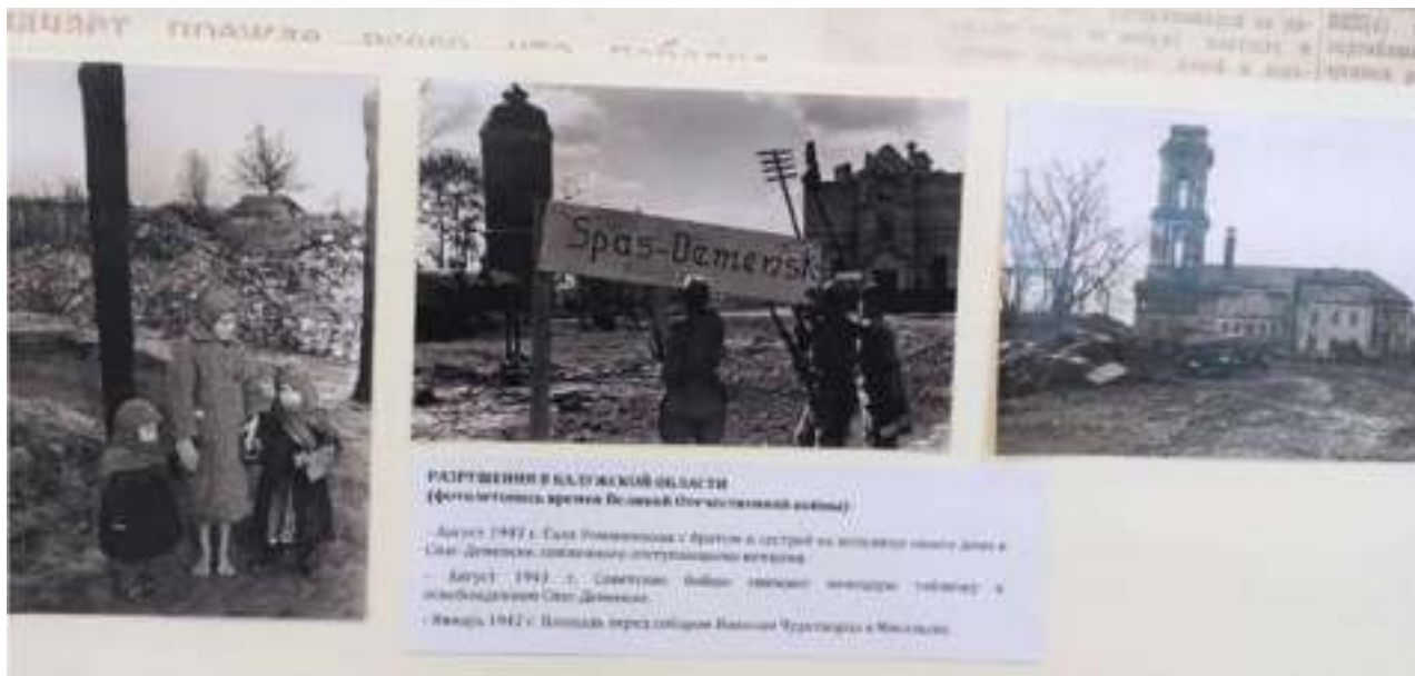
РАЗРУШЕНИЯ В КАЛУЖСКОЙ ОБЛАСТИ (фото сделаны в период Великой Отечественной войны) - Август 1942 г. Село Успенское с фронтом восточнее села дома в Спас-Деменинском сельском поселении полностью уничтожены. - Август 1942 г. Советские бойцы заняли немецкие позиции в окрестностях Спас-Деменина. - Январь 1943 г. Всплеск перед освобождением Калининградского и Могилевского.