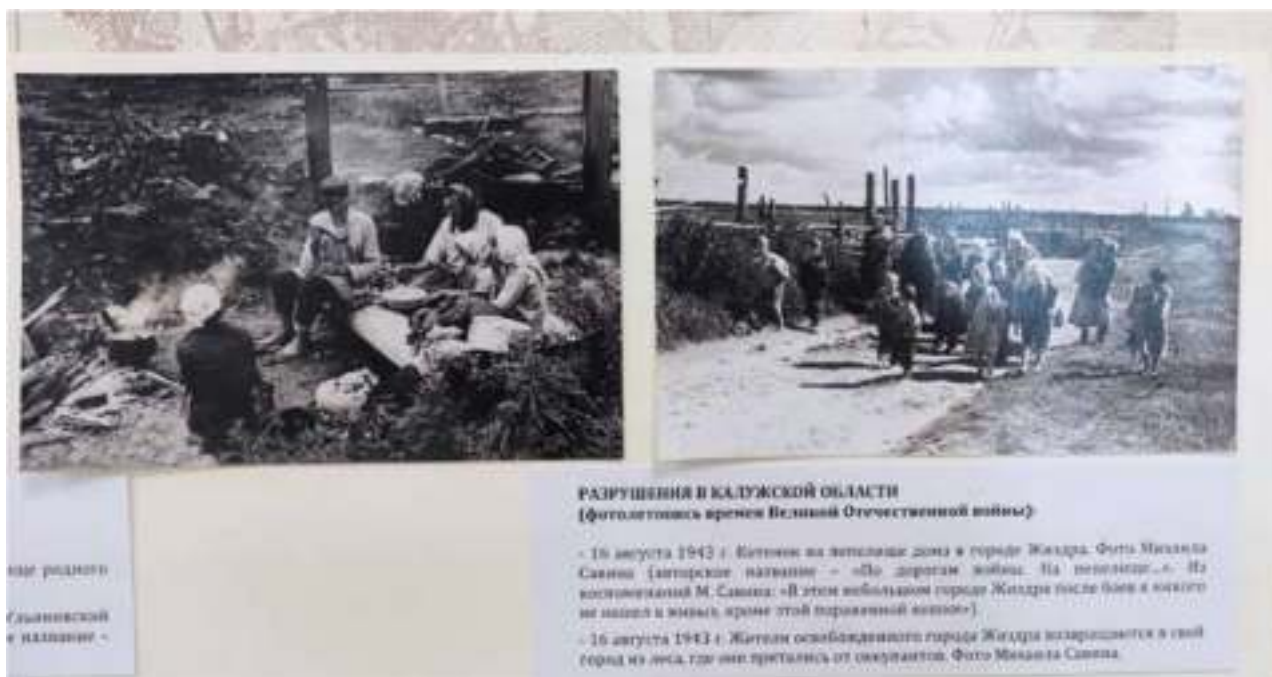
РАЗРУШЕНИЯ В КАЛУЖСКОЙ ОБЛАСТИ (фото сделаны в период Великой Отечественной войны) - 16 августа 1942 г. Детишки на выжженных домах в городе Жиддра. (латвийское название - «По дороге в Жиддра. На выжженных»). На выжженных М. Савина: «В этом выжженном городе Жиддра после боя в окопы не вошел и человек, кроме этой порванной женщины». - 16 августа 1943 г. Жители освобожденного города Жиддра возвращаются в свой город из леса, где они прятались от оккупантов.